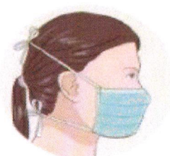
J'attache le bas de mon masque