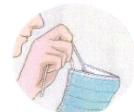
Pour le retirer, je ne touche que les attaches