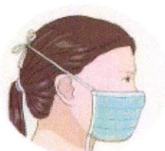
J'attache le haut de mon masque