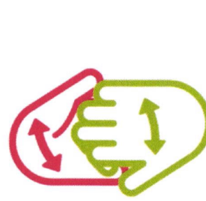
Dos des doigts