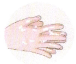
Je jette mon masque et je me lave les mains