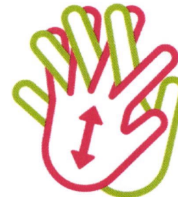
Entre les doigts