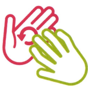
Pointes des doigts