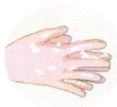
Je me lave les mains